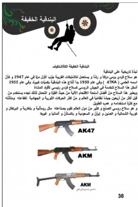
Pagina uit ISIS-lesboek over inzet en gebruik wapens

De lesboeken, zoals het basisschoolboek 'Ik ben moslim', onderbouwen een wereldbeeld waarbij de ideeën van ISIS juist zijn en alle andere onjuist. Lesmateriaal is geïllustreerd met afbeeldingen van handgranaten, tanks en gevechtsposities: zo wordt het onderwijs gekoppeld aan de militaire strategie van ISIS. Daarnaast krijgen kinderen theorieles over onderwerpen die met de strijd te maken hebben, zoals het herkennen van verschillende wapentypes, en in welke situatie deze het best ingezet kunnen worden. Een belangrijke focus in het curriculum is het versterken van het wij-zij-gevoel. De 'kruisvaarderscoalitie' (waar Nederland deel van uitmaakt) is hier de vijand die uitgeroeid zou moeten worden. 7 Iedereen die zich niet tegen de coalitie uitspreekt wordt bestempeld als ongelovige of, in het geval van moslims, als afvallige. Dit betekent volgens ISIS dat hij of zij gedood mag worden.