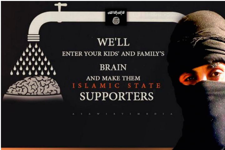
Voorbeeld van ISIS-propaganda