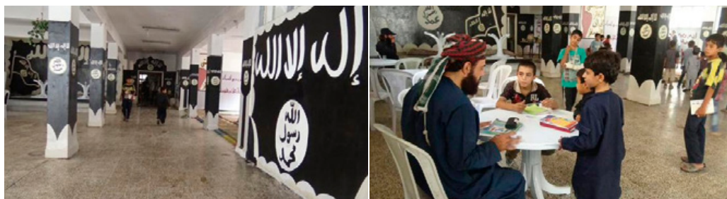
Binnenin een ISIS-school zoals in propaganda geportretteerd

Uit ISIS-propaganda komt naar voren dat onderwijs een cruciale rol speelt in het 'kalifaat'. Dit blijkt onder andere uit de oprichting van het 'ministerie van educatie' dat onderwijs voor jongens tussen 6 en 18 jaar en meisjes tussen 6 en 15 jaar verplicht heeft gesteld. 6 Het is onwaarschijnlijk dat, ondanks deze verplichtstelling, alle kinderen in ISIS-gebied daadwerkelijk naar school gaan. Waarschijnlijk houdt een aanzienlijk deel van de lokale bevolking, en mogelijk ook sommige buitenlandse strijders, hun kinderen thuis. Daarnaast zijn er steeds minder goed functionerende scholen door de verslechterde veiligheids-situatie. Of zijn scholen door een gebrek aan personeel gedwongen om - al dan niet tijdelijk - de deuren te sluiten.