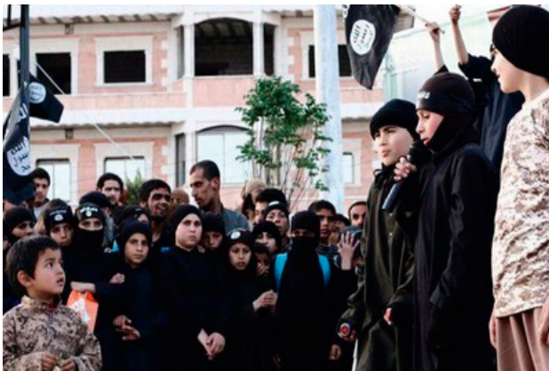
Minderjarige prediker in propagandavideo

Sommige minderjarigen vervullen een specifieke rol in het ‘kalifaat’: dit kan uiteenlopen van huisvrouw of verklikker tot soldaat of beul. Kinderen, zowel jongens als meisjes, worden aangespoord informatie te delen over familieleden, burens of vrienden die zich niet conformeren aan de regels van ISIS. Hierbij functioneert het ‘kalifaat’ als een totalitaire staat die controle wil over zijn burgers. De inzet van kinderen voor dergelijke rollen is gebruikelijk in een totalitair regime. Als de kinderen bewijzen loyaal aan ISIS te zijn, door deze rol naar behoren te vervullen, kunnen ze doorgroeien naar een rol met meer verantwoordelijkheid.