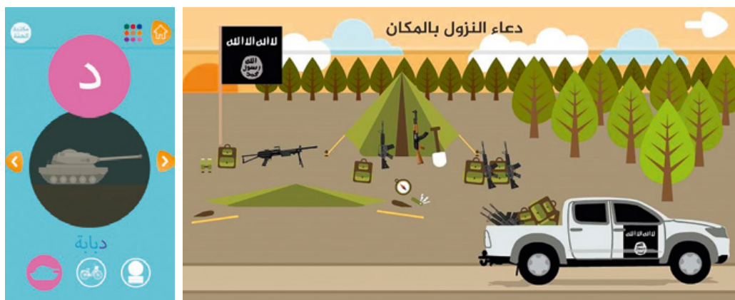
Apps voor jonge kinderen

Deze beïnvloeding van kinderen gebeurt al op vroege leeftijd. De app Huroof (alfabet), bestemd voor de allerjongsten, leert ze spelenderwijs gewelddadige of jihadistische woordjes, zoals 'dababa' (tank). Ook zijn er apps waarin kinderen spelenderwijs de coalitielanden kunnen aanvallen, door bijvoorbeeld raketten af te vuren op westerse gevechtsvliegtuigen of de Eiffeltoren.