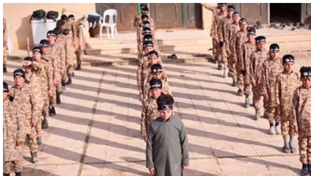
Beeld uit propagandavideo over trainingskamp voor kinderen

Jongens kunnen ook aangemeld worden door hun ouders, of zelfstandig besluiten bij zo'n kamp te gaan. Deze kampen volgen het voorbeeld van trainingskampen voor volwassenen. Jongens kunnen mogelijk al vanaf 9 jaar meedoen en worden daar ingedeeld in gespecialiseerde richtingen als strijder, aanslagpleger, bommenmaker of sluipschutter. De opleiding bestaat uit een ideologische en militaire vorming. Een dag in een trainingskamp bestaat bijvoorbeeld uit het volgen van Koranlessen, fysieke training en het leren van tactieken, zoals het oefenen van onthoofden op een pop.