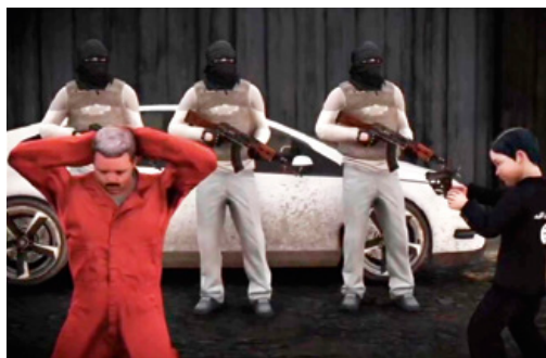
Beeld uit propagandavideo die het videospel imiteert

Europa. Andere video's toonden minderjarigen die optraden als beulen en op camera gevangenen vermoordden. Hierbij werd realiteit dikwijls met een (video)spel gecombineerd door de manier van filmen vanuit het perspectief van de schutter. Ook zeer jonge kinderen hebben executies uitgevoerd op camera. In een video uit januari 2017 schoot een kleuter een 'PKK-gevangene' dood, en keek toe hoe een iets oudere jongen een andere gevangene onthoofdt.